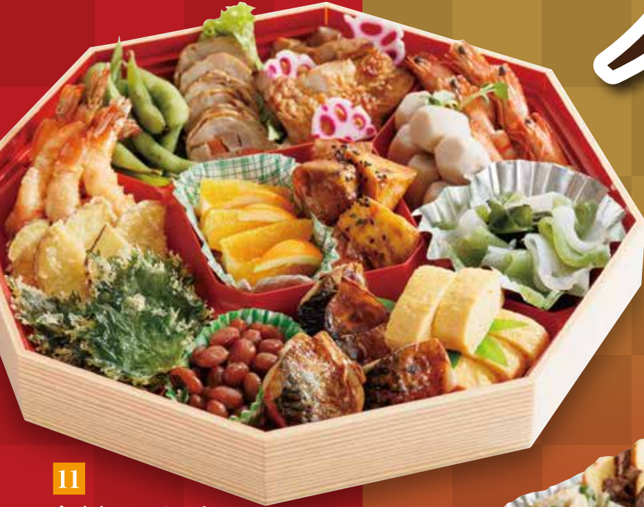
11 和風オードブル 5,400円(税込)