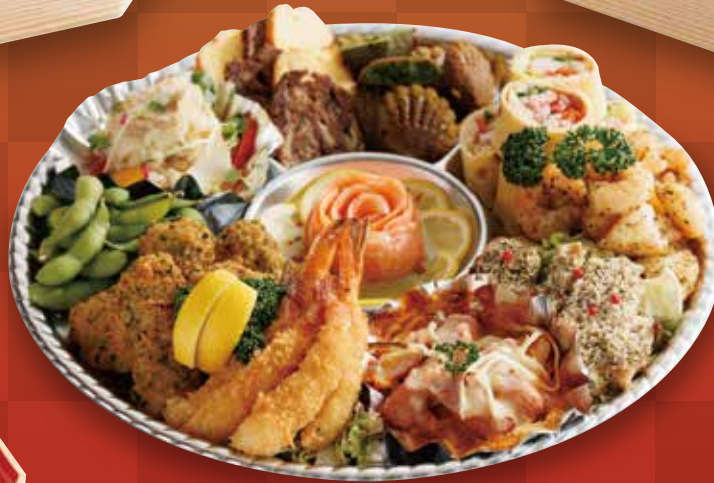
13 洋風オードブル 5,400円(税込)