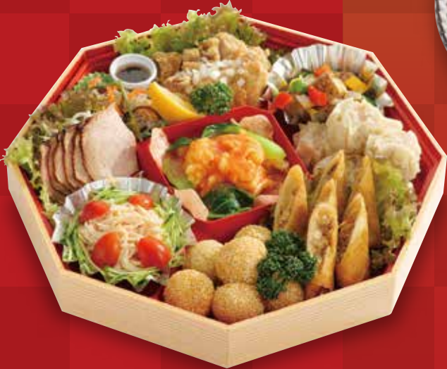
12 中華オードブル 5,400円(税込)

30 新メニュー 近江牛ビーフシチューと ローストビーフの盛合せ 12,000円(税込)