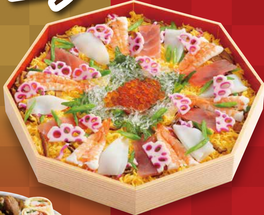
14 海鮮ちらし寿司 4,860円(税込)